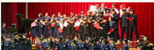
全校合唱 ハビネス