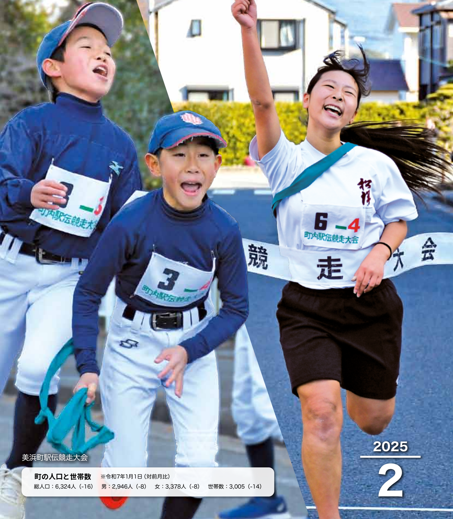
美浜町駅伝競走大会