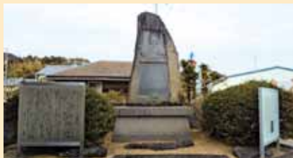
クヌッセン慰霊碑（徳島県海陽町浅川）