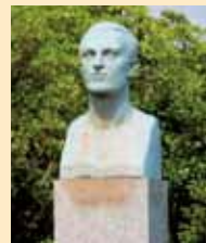
クヌッセン胸像（日ノ岬・クヌッセンの丘）