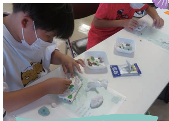
シーグラスでキーフックを作ろう