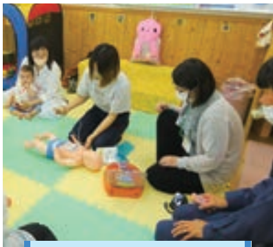
お母さんたちも順番に実践