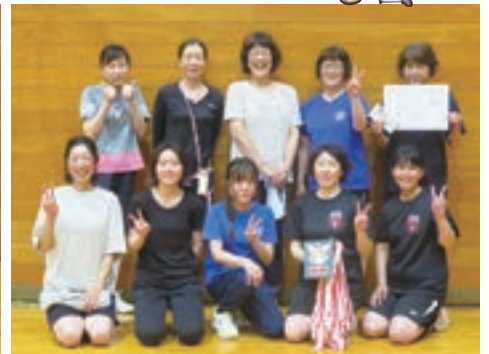
準優勝 ひつつき虫