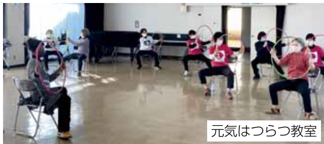
元気はつらつ教室