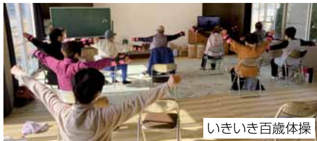
いきいき百歳体操