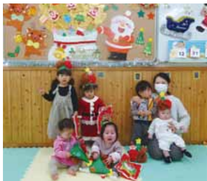
クリスマスの帽子作り