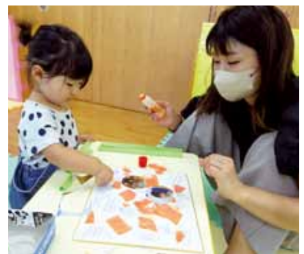
敬老の日のプレゼントを作ろう