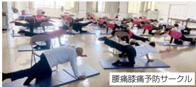
腰痛膝痛予防サークル