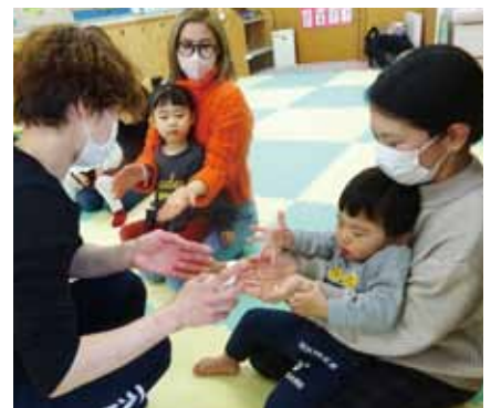
栄養士の先生のお話