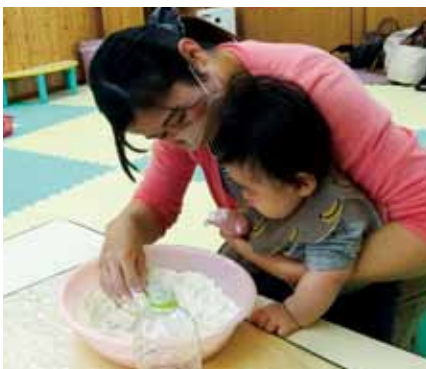
小麦粉粘土で遊ぼう