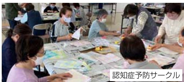
認知症予防サークル