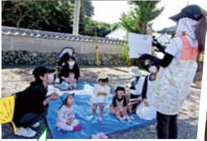
御崎神社の境内で休憩タイム