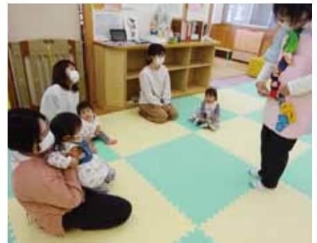
お母さんと一緒に手遊びをしたり、エプロンシアターを見たりして楽しみました。