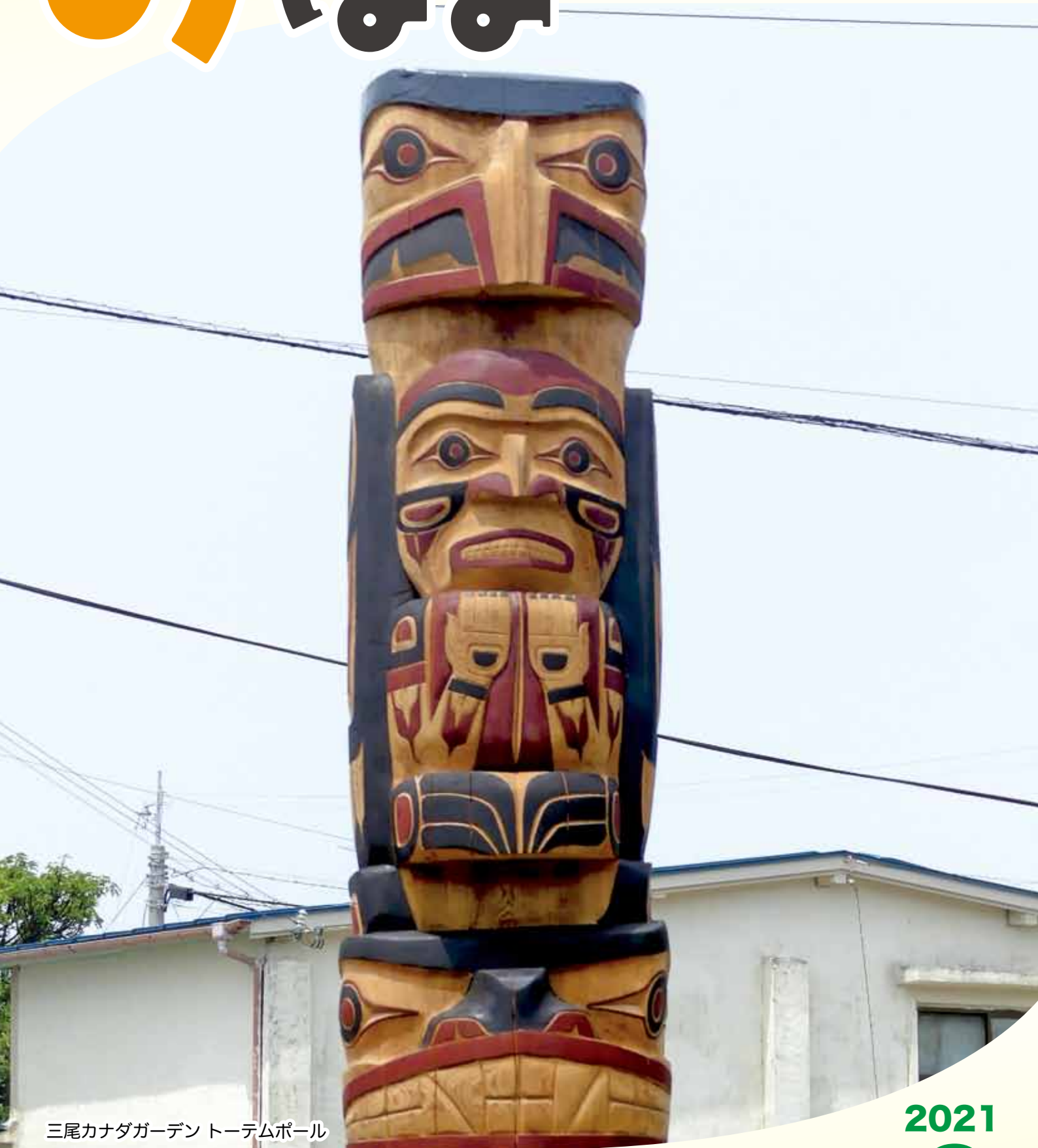
三尾カナダガーデン トーテムポール