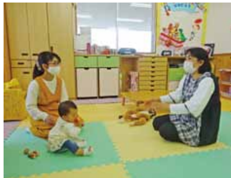
サイコロトークでお母さん同士やスタッフとのおしゃべりを楽しみました。