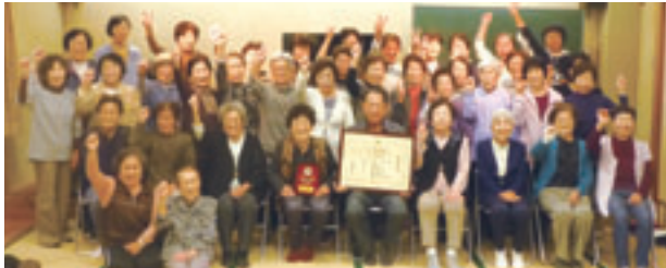
▲元気いっぱいの記念撮影

昭和38年に結成して以降、50年以上にわたって子どもたちの下校時の見守りや町内の清掃ボランティアなどの社会奉仕を行ったことに加え、いきいき百歳体操を通じて高齢者の健康増進や地域のつながり作りの取り組みをしたことが高く評価され、今回の受章につながりました。