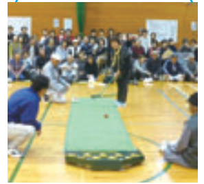
スカットボール競技