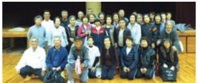
準優勝 和田東・東中チーム