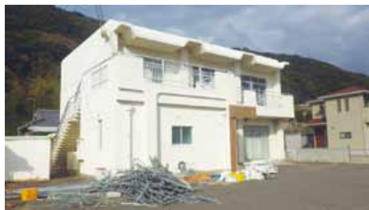
▲アメリカ村レストランに改修中

地方創生統括官 事業計画は町が決め、それにのっとり協議会が年間計画を決め、その枠の中で日々の管理をNPOが運