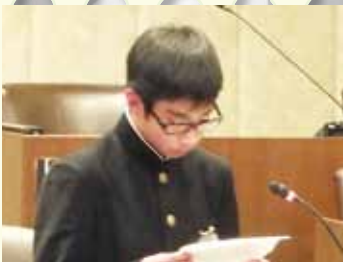
質問者 山本 翼 議員