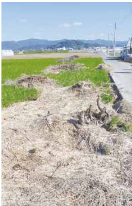
▲押し寄せられた稲わら

Q 所得制限を設けて、第3子以降を手厚くすることを検討できないか。 A 若い夫婦等を応援できたらと思うっており、一度勉強させてほしい。