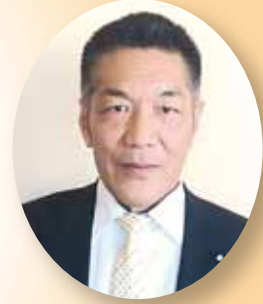
碓井 啓介 議員