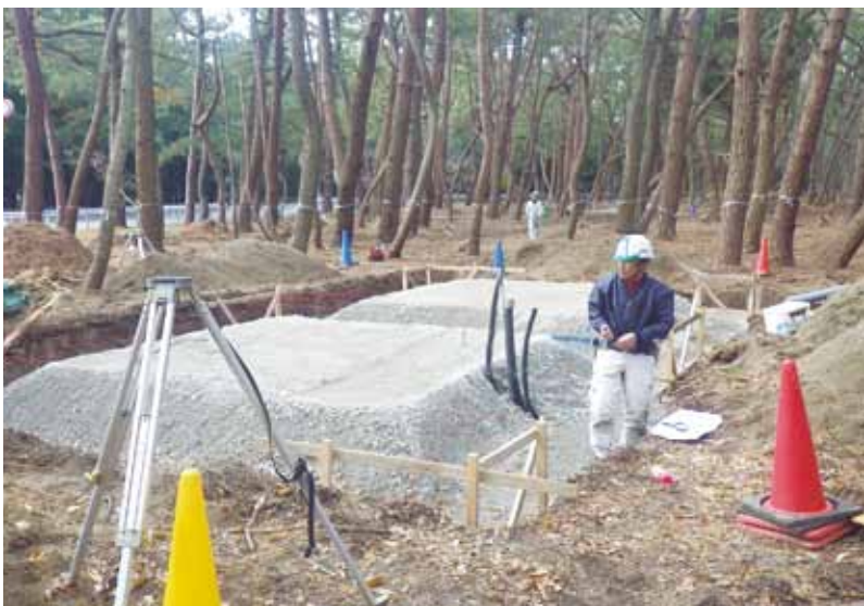
▲プロジェクトBの吉原公園