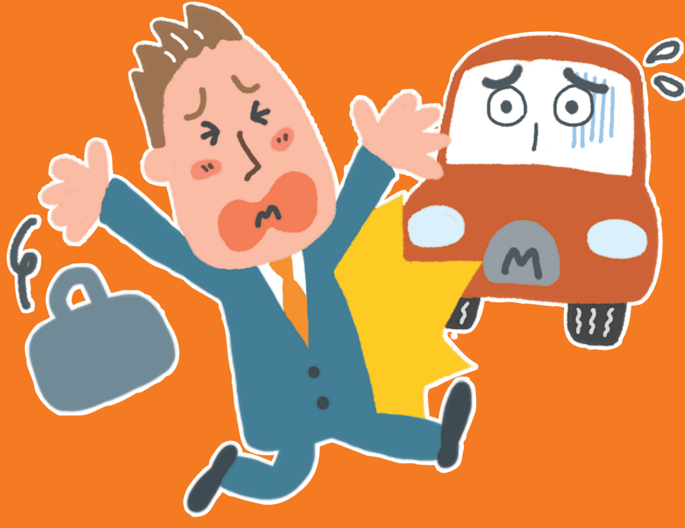
交通事故にあった