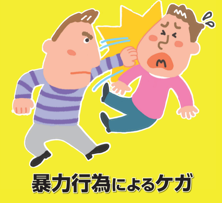
暴力行為によるケガ