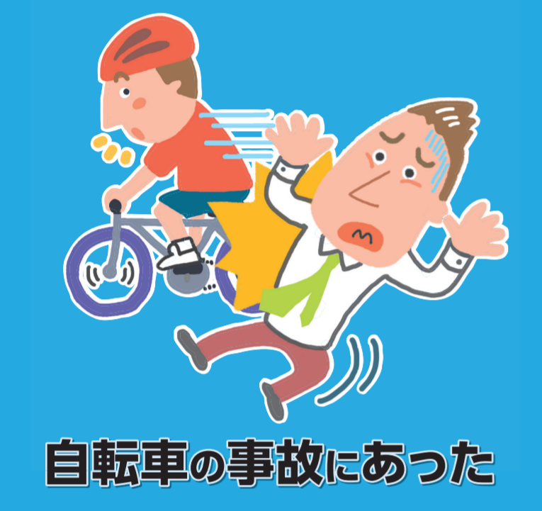
自転車の事故にあった