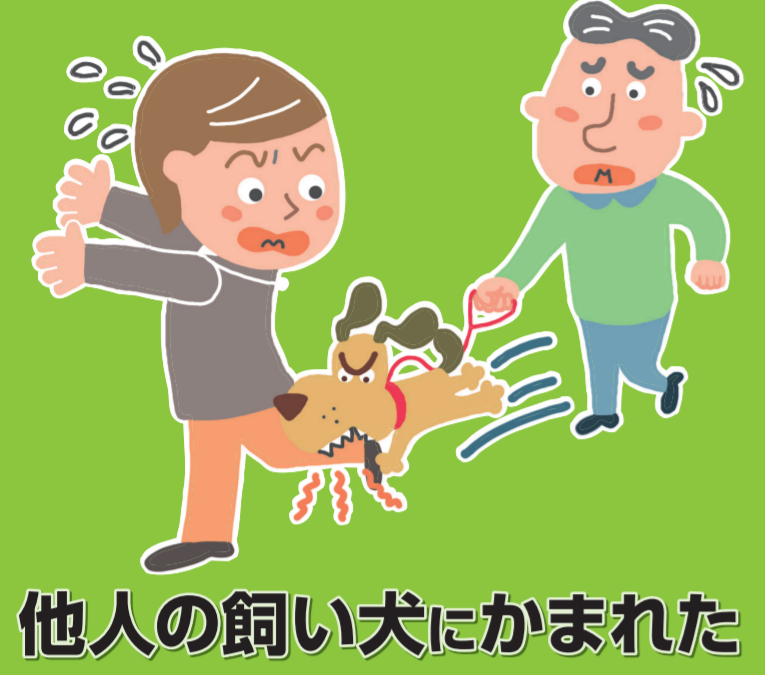
他人の飼い犬にかまれた