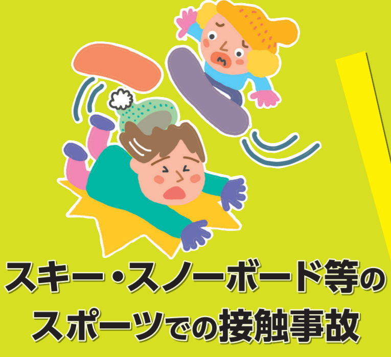
スキー・スノーボード等のスポーツでの接触事故