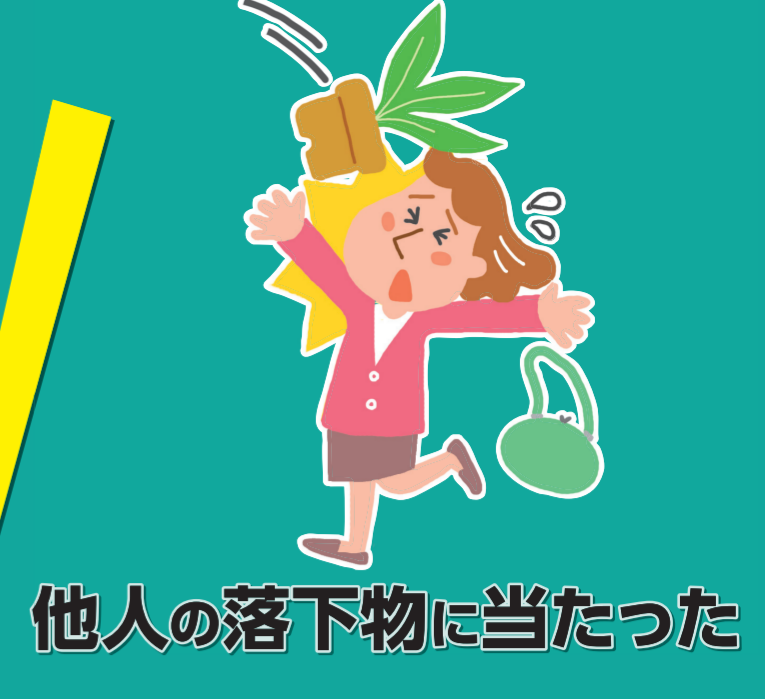
他人の落下物に当たった