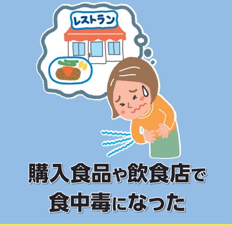
購入食品や飲食店で食中毒になった