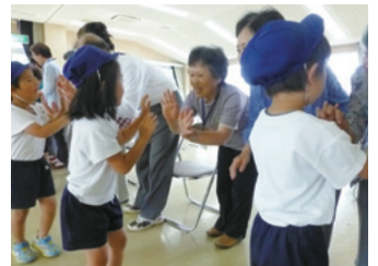
ハイタッチでバイバイ！