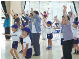
まつりん&ぼっくりん体操