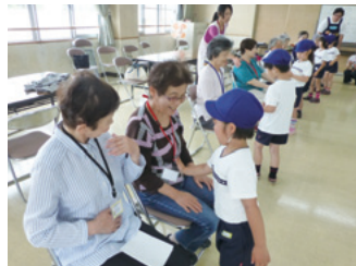
お礼のお歌とマッサージ