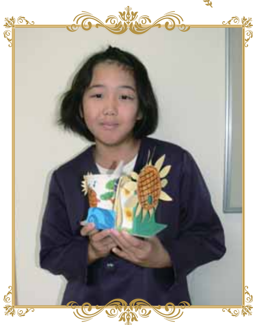
工作の部 「ひまわりと美浜町の仲間たち」