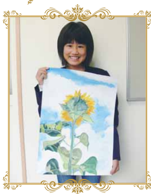
図画の部 「前を向いて」