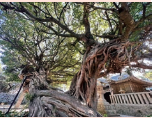
境内のアコウの大木

三尾漁港近くの小高い場所に、龍神様を祀る龍王神社があります。境内には、樹齢300~350年といわれる珍しいアコウの木があり、この村の守り神のような雰囲気を醸し出しています。根回り10m、枝元まで11mにもなる巨木で、アジア東部の垂熱帯植物であるアコウは、このあたりが北限といわれています。