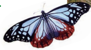
西山ピクニック緑地からの展望／飛来するアサギマダラ