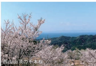
西山山頂の千本桜