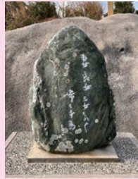
上:内田稲人の句碑 右:高浜虚子の句碑

紀伊日ノ御崎灯台の側には、「ホトトギス」の会員で初代・灯台長を務めた内田稲人の家族に悲劇が訪れます。家族を失った悲しみに耐えながら灯台を守り続ける内田を慰め、哀悼の句を認めた高浜虚子の句碑が立っています。またその隣には、愛する家族を偲び詠んだ内田の句碑が立っています。