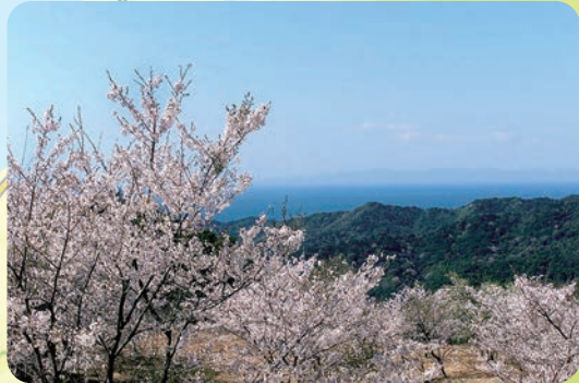
西山千本桜(日高町)