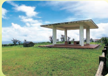
西山ピクニック緑地