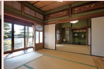
左:どっしりとした美しい邸宅／中:海の見える談話室／右:間取りは平屋の7DK