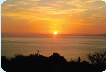
紀伊日ノ御埼灯台(日ノ岬灯台)